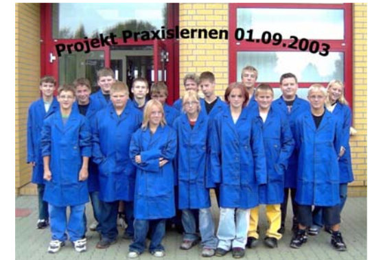
2003 Projektbeginn - Praxislernen